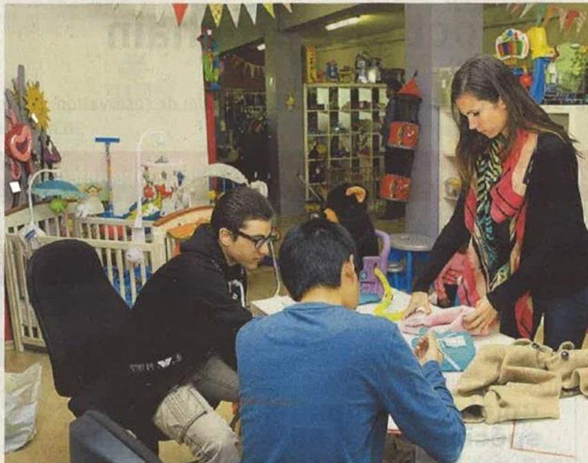
Les jeunes du SeMo gèrent notamment des boutiques d'habits de seconde main, comme ici chez Ali Bébé, à Yverdon. Ils sont coachés par une éducatrice (à dr.).

Les six SeMo vaudois offrent une large palette d'activités comme la préparation et la livraison de repas dans des garderies, l'entretien et la gestion de vélos en libre-service (Velopass), la gestion d'une buanderie pour des personnes suivies par un centre médico-so-